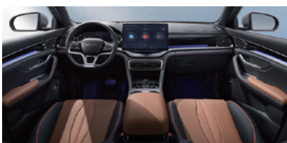
Svart och brun